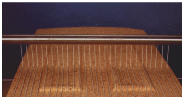
Mixon 1800 tillåter applicering av limsträngar på ojämnt underlag.