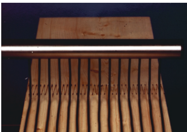
Mixon 1800 ger en jämn tillförsel av lim

Frekvensstyrd pumpmotor offereras vid förfrågan.